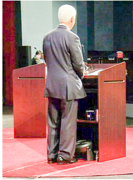
This video frame grab made available by CBS 4, shows a fan at the bottom of the lectern near Democratic gubernatorial candidate Charlie Crist in Davie, Fla., Wednesday Oct. 15, 2014. The fan caused a delay in the gubernatorial debate between Crist and Governor Rick Scott, after the Scott campaign considered the fan a violation of the rules prohibiting the use of electronic devices.

Just before the curtain opened, Crist's handlers insisted on placing the fan behind his lectern near his feet, and Scott's handlers demanded that the