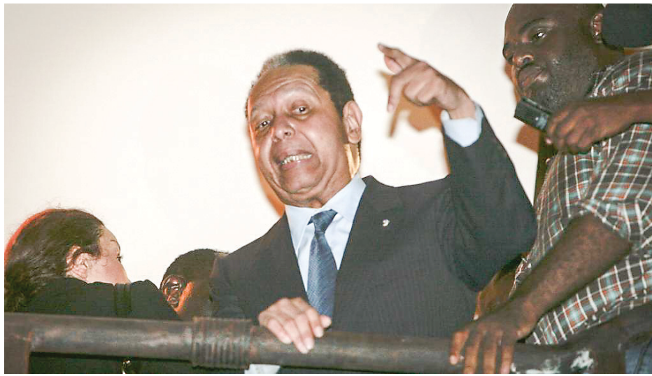
L'ex-président Duvalier, le 16 janvier 2011

Dans le détail je pense qu'elle est méconnue. Grosso modo évidem-