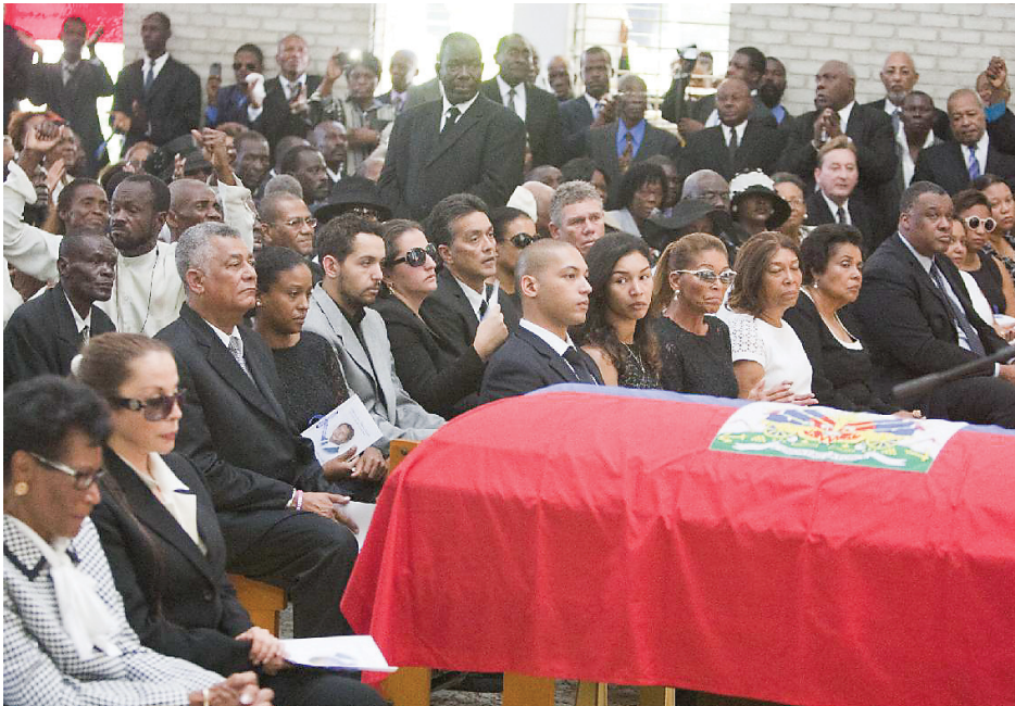
Friends and family of Haiti's late Dictator Jean-Claude "Baby Doc" Duvalier attend his funeral ceremony in Port-au-Prince, Haiti, Saturday, Oct. 11, 2014.