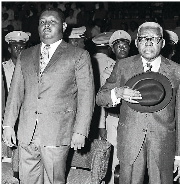
Jean Claude and Francois Duvalier

Reforming or dismantling established oppressive political systems has never been painless. This fact partly explains why Papa Doc presided over a repres-