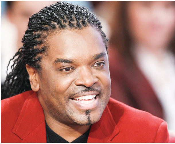
Anthony Kavanagh: "Mes parents m'ont élevé en me montrant que nous étions égaux"

Plus habitué à faire rire les spectateurs qu'à les divertir en dansant le fox-trot, le comédien québécois affirme un premier temps que sa participation au télé-crochet n'est pas de tout repos. «Mon corps est conditionné et programmé pour être performant le soir, entre 20 heures et minuit. En ce moment, je danse toute la journée. C'est très physique et je passe par toutes les émotions: rire, larmes, excitation, peur, nervosité...» Ravi d'avoir une partenaire