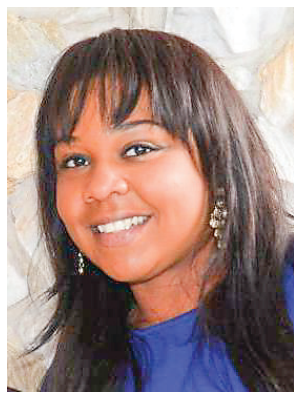
By Joann Millord

Miami is the epitome of a melting pot, with the weather of the Caribbean. However, Miami is not just South Beach. There are so many cultures to explore and that is the true beauty of this city. Each culture has formed an enclave welcoming fellow