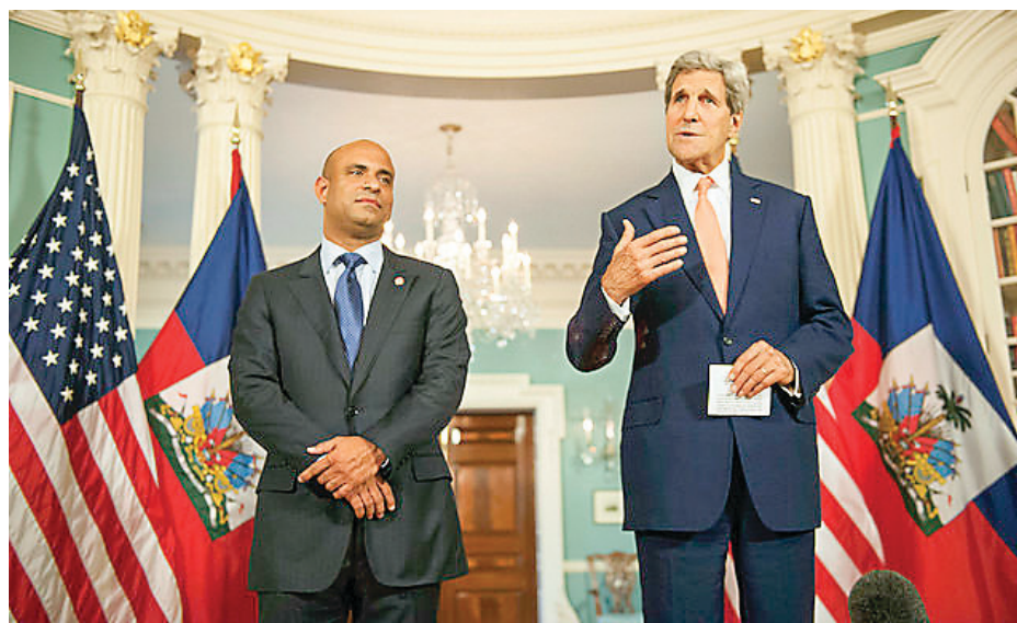
U.S. Secretary of State John Kerry meets with Haitian Prime Minister Laurent Lamothe at the Department of State in Washington, D.C., October 9, 2014. Lamothe was named innovative leader of the year in September.

But, there are politicians like Bill Clinton and Martelly who genuinely enjoy such things, allowing the sincerity of the moment to be captured clearly. In Lamothe's case, however, photos of the communications mogul in photo ops look awkward.