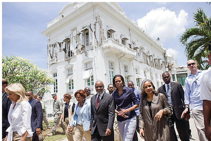
"Samantha Appleton captured this scene as the First Lady and Dr. Jill Biden toured earthquake damage in Port Au-Prince, Haiti, along with Haitian President René Préval, and Elisabeth Delatour Préval.

It leaves people with the wrong impression that Preval did precious little while he was in power. Preval's failure was that, unlike them, he was blasé when it came to taking credit and was more concerned about building