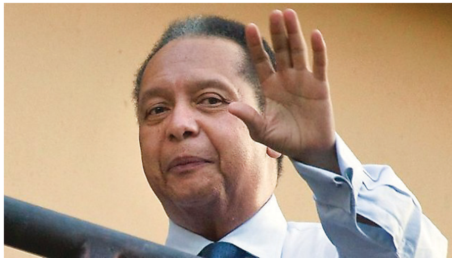
L'ex-dictateur haïtien Jean-Claude Duvalier alias "Bébé Doc" (3 Juillet 1951 – 4 Octobre 2014)

Depuis son retour, de nombreuses plaintes ont été déposées contre lui, pour arrestations illégales, tortures, emprisonnements et exil forcé de ses opposants mais aussi détournements de fonds lors de ses 15 années à la tête du pays le plus pauvre des Amériques.