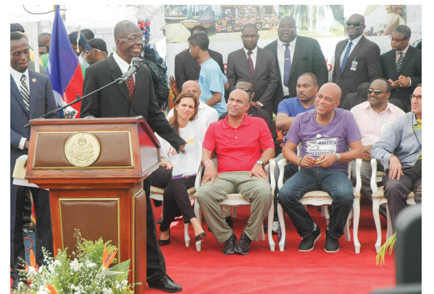
Le représentant des Associations de Chauffeurs de Taxi Touristiques du Cap-Haïtien lors de son intervention.