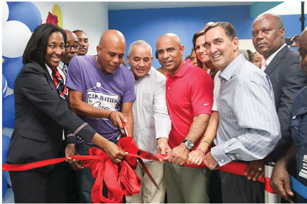
Coupe de ruban pour l'inauguration de la nouvelle salle d'arrivée de l'aéroport International du Cap-Haïtien le jeudi 2 octobre.