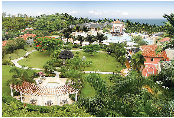
A rendering of the proposed resort development at Côté de Fer, Haiti.