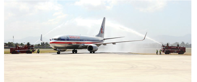
Le boeing 737 de la American Airlines a été accueilli à l'aéroport international du Cap-Haïtien par les jets d'eau des pompiers pour marquer l'évènement.