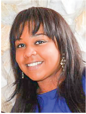
By Joann Millord

You may have seen the bright yellow banners that hang down the lampposts along NE 2nd Avenue between 54th St. and 62nd St. In a