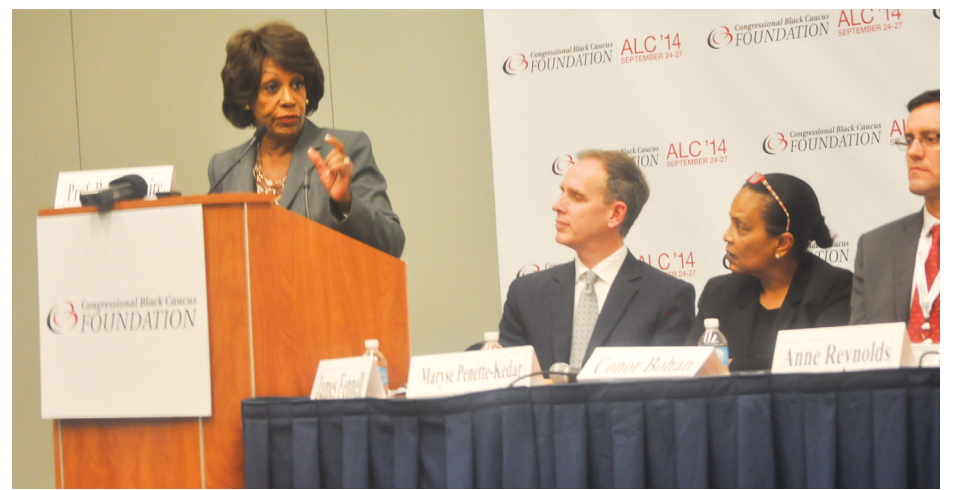
During a session on Haiti entitled "HAITI: The Path to the Future", Maxine Waters ( U.S. Representative for California's 43rd congressional district) a big supporter of Aristide made the case clear to stay strong against any "arrestation" of the former president.

While the discussion was about the future of Haiti, paradoxically the Martelly-Lamothe government was not represented at the table. Each pan-