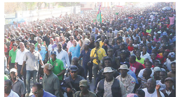
Comme pour faire une démonstration de sa popularité dans le nord du pays, Martelly a marché dans les rues du Cap-Haïtien à la tête d'une foule zélée composée de plusieurs milliers de personnes.

journal Le Floridien, étaient aussi à bord pour couvrir l'évènement.