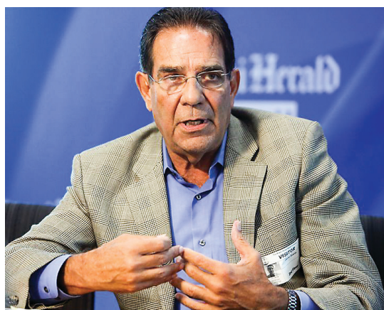
The first unofficial rival to Miami-Dade Mayor Carlos Gimenez's reelection may be slowly stepping forward.

Another possibility is Suarez's son, Francis, also a city commissioner but eligible for another term