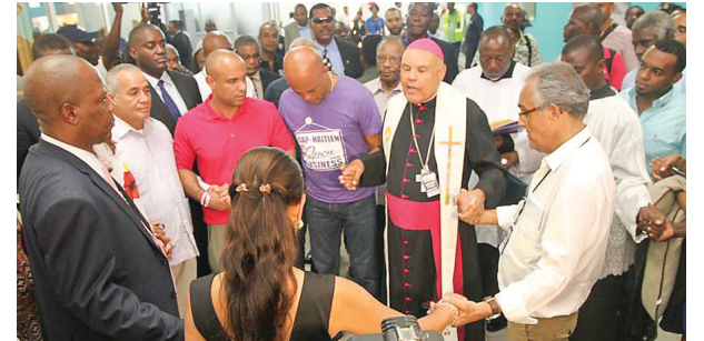
Un moment de prière dirigé par Mgr. Louis N. Kébreau, archevêque de la ville du Cap-Haïtien.