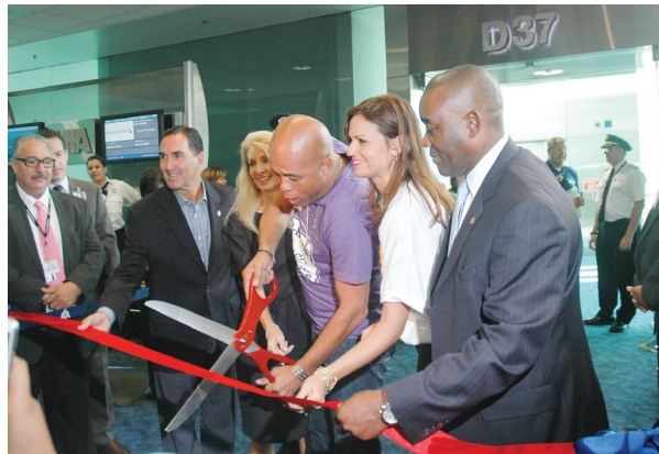
Coupe de ruban pour le vol inaugural AA Miami / Cap-Haïtien à l'aéroport International de Miami le jeudi 2 octobre.

Rentré de Port-au-Prince la veille, le président Martelly a regagné Haïti sur le vol inaugural "AA 1662" Miami / Cap-Haïtien. Le boeing a décollé vers 9 heures 59 du matin pour atterrir au Cap-Haïtien à 11hr 42 minutes, après avoir fait le tour de la cité christophienne à deux reprises. Le vice-