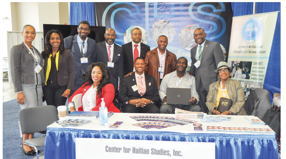
The Center for Haitian Studies in the Little Haiti neighborhood of Miami was part of the Exhibit showcase.