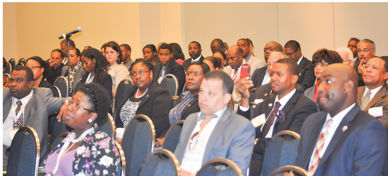
View of the audience at "The Haiti We See" Conference in Washington DC.

fessionals such as doctors, lawyers, teachers, social workers and entrepreneurs living in the USA, particularly in south Florida, where she is practicing. Pamies believes those professionals can help, each in his or her respective field, the native land move forward. "It would be a good idea if the Haitian government can use our expertise as professionals," Austin said.