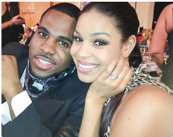
Le chanteur américain d'origine haïtienne Jason Derulo et son désormais ex-petite amie, la chanteuse-actrice Jordin Sparks

Le 26 septembre, il a posté une coupure de presse où on peut lire : "Bien que je pense que cette affaire soit privée et que j'ai tenté de garder ma rupture avec Jordin personnelle, à cause de mensonges farfelus et irresponsables rapportés par des médias insensibles, il est devenu urgent que je m'exprime. J'ai passé 3 belles années avec Jordin et elle est une des personnes les plus incroyables que j'ai rencontrées. Mais comme dans toutes relations, il y a des hauts et des bas et à ce stade on a décidé de rompre à l'amiable. L'infidélité, la tromperie ou la déception, n'ont rien à voir dans notre couple ou notre