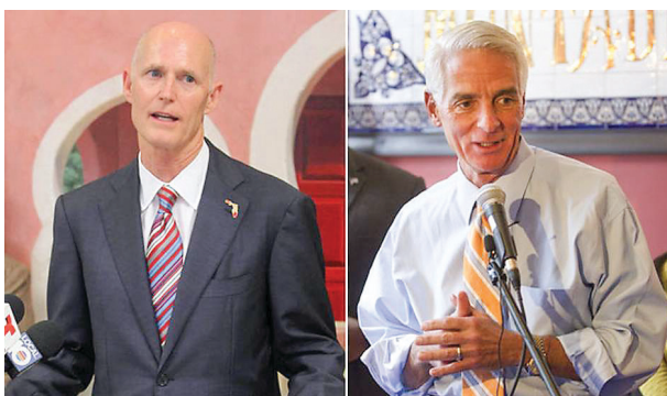
Gov. Rick Scott and Charlie Crist

The apparent trend in Crist's favor dovetails with his campaign's decision to ramp up its ad spending statewide to counteract the effectiveness of Scott's longer and larger media blitz.