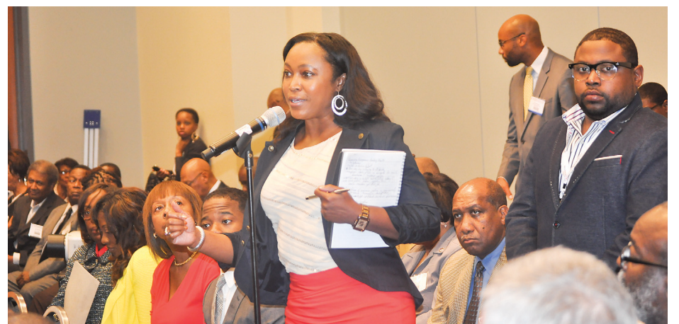
A participant asking questions during the session "How to Grow Your Business in The Federal Marketplace"

elist had five minutes to share their experience in Haiti and express their feeling about the current situation in the first black republic.