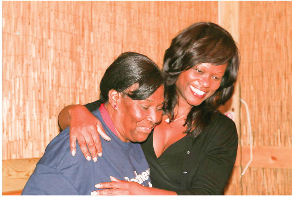
Bichotte and her mother at Tonel Restaurant in Brooklyn

On Tuesday night the air was crisp in the back room of Tonel Restaurant where a group of anx-