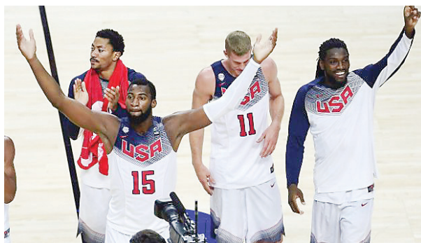
Les USA champions du monde de Basket

Ce succès qui marquera l'histoire porte l'empreinte de Mike Krzyzewski, lequel a inculqué sa rigueur,