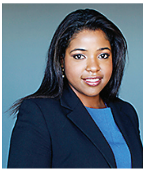
By Patricia Elizee, Esq

There is much uncertainty and fear in the life of any undocumented person living in the United States. The biggest fear of most undocumented is the fear of being discovered by ICE, the Immigration and Customs Enforcement agency, being separated from their family, and