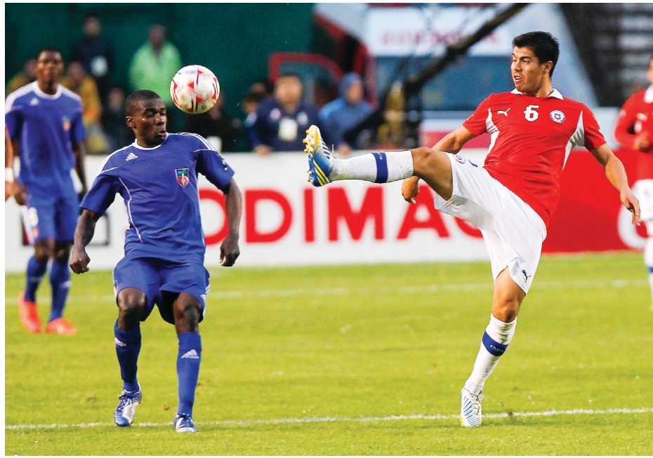
Une phase de jeu de la rencontre Haïti-Chili le mardi 9 septembre 2014 au Lockhart Stadium de Fort-Lauderdale.

Au retour des vestiaires, les Grenadiers à trois reprises ont fait trouver l'égalisation par deux fois