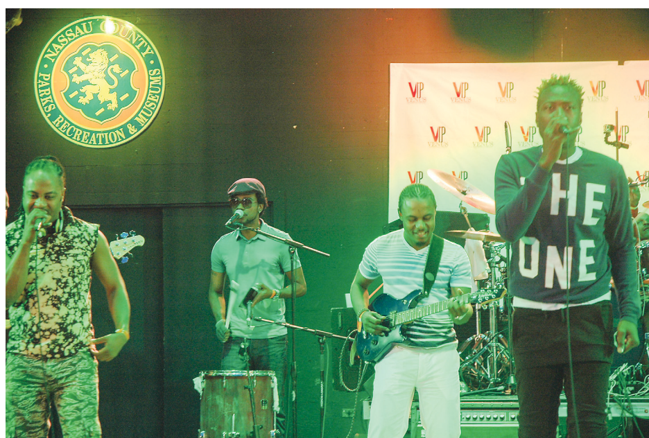
Le groupe dISIP en prestation live à "Eisenhower Park" le samedi 30 août 2014