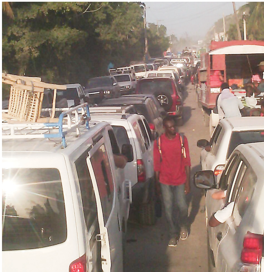
C'est l'embouteillage au quotidien sur le tronçon qui traverse sur moins de 3 km la route des rails (Carrefour) - Mariani. Les usagers de cette importante voie l'ont baptisée " le parcours du combattant ".

J'en ai fait l'amère expérience à deux reprises, et ceci deux jours suivis, lors de mon récent séjour en Haïti le mois d'août écoulé. Partir de Petit-Goâve vers 11 heures du matin, nous étions déjà à Gressier moins d'une heure et demie après. La Nationale No. 2 est en très bon état. Notre calvaire a commencé à l'approche de Mariani, plus particulièrement au niveau du Lambi Night-Club. Si j'avais pris plus d'une heure dans cet embouteillage au niveau du tronçon Route des rails/Mariani en quittant Port-au-Prince, il m'a fallu plus de deux heures pour faire le même exercice à mon retour. Les files interminables de véhicules et la cacophonie des klaxons caractérisent ce point noir tout au long de la semaine.