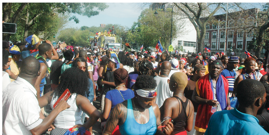
Le char de T-Vice animant la foule des carnavaliers au niveau de Norstrand Avenue sur Eastern Parkway, Brooklyn, l'après-midi du lundi 1er septembre 2014.

BROOKLYN - Comme le veut la tradition, la grande parade caribéenne "West Indian American Day Carnival Parade" de Brooklyn a lieu tous les ans le lundi du long week-end de Labor Day. Pour cette année 2014, cette grande fête culturelle qui rassemble sur Eastern Parkway - entre Utica Avenue et Grand Army Plaza - des dizaines de milliers d'immigrants originaires des îles des Caraïbes comme la Jamaïque, les Barbades, Trinidad et Tobago et Haïti, a été célébrée le lundi 1er septembre écoulé. SUITE PAGE 15