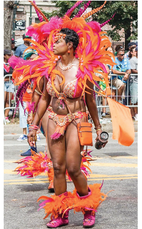
Une danseuse du carnaval

Signalons que pour une des rares fois, les chars haïtiens ont effectué tout le