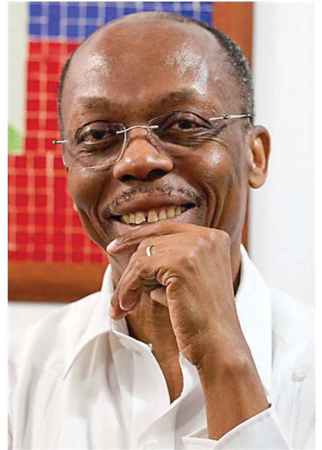
L'ex-président d'Haïti Jean Bertrand Aristide

Somme toute, la démocratie ne se construit pas sans casse. Tant qu'il y aura des citoyens que la justice ne pourra entendre qu'en temps "opportun," nous ne serons pas sur la bonne voie. Une justice qui attend le moment opportun pour fonctionner est, par définition, une justice oppor-