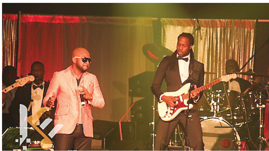
Le groupe Nu Look en spectacle à Amazura, Queens, le vendredi 26 août 2014.

Si de l'avis de nombreuses personnalités de l'industrie musicale haïtienne